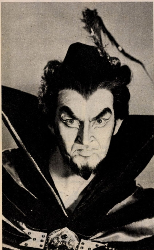
A Faust Mefisztójaként