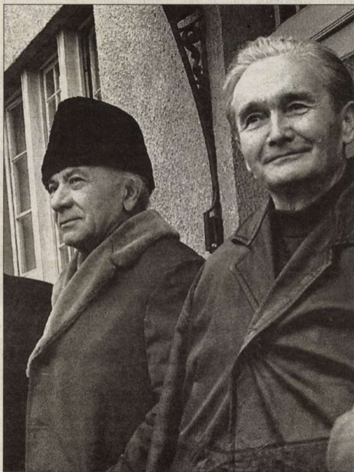
A Németh Lászlóban lakozó vidék, az ő „tájháza”, az ő szülői földje az egykori Szilasbalhás és a Mezőföld